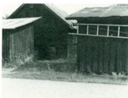
Lund 1:18 och 1:21