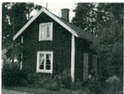
Hammar 1:135, uthus med bostadsrum